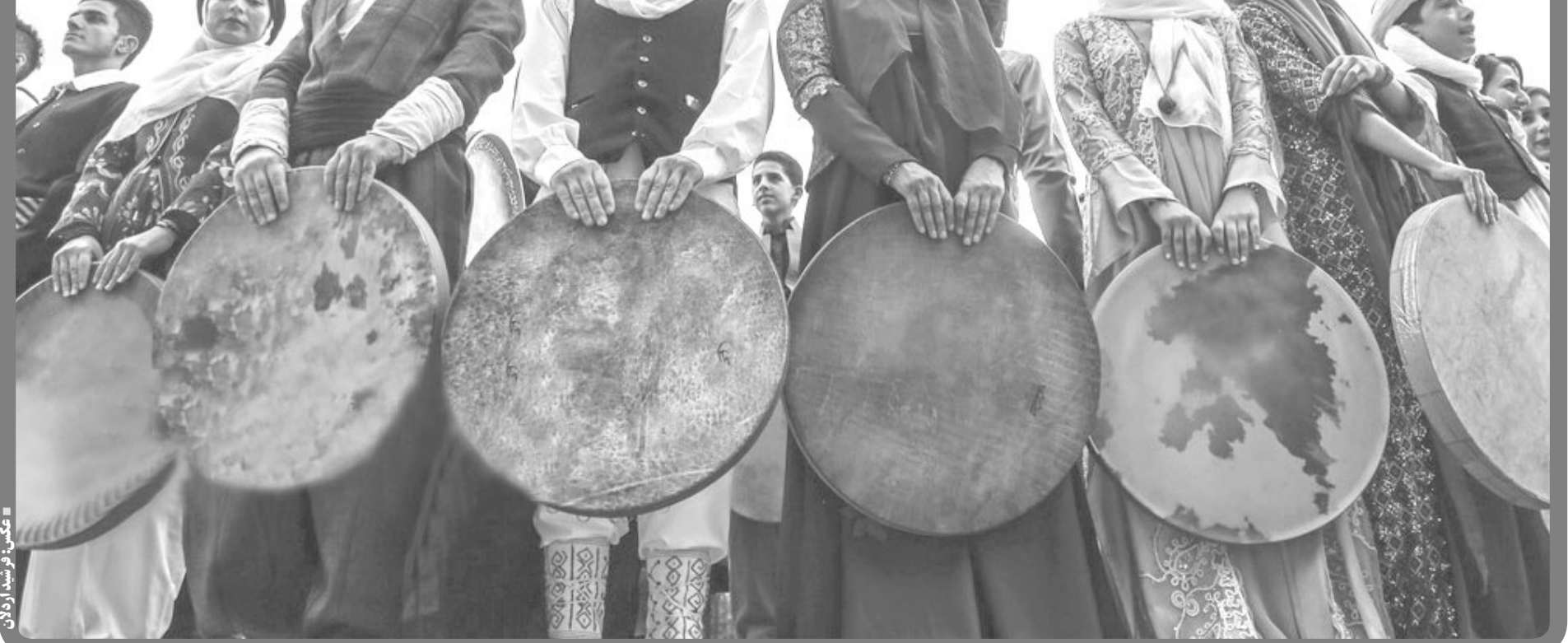
عید قربان در اردلان

قربانی، آیینی مذهبی است که در میان اقوام و ملل مختلف با اهداف گوناگون رواج دارد. بسیاری از سنت‌های دینی برای جلب رضای خدا و دورماندن از بلاها و رفع آن، ذبح حیوانی را توصیه می‌کنند. باور پلگاردانی میان قوم بختیاری با هدف انتقال شر و دور ریختن آن از زمان‌های قدیم وجود داشته است. این قوم بر اساس آموزه‌های دین اسلام و در روز عید قربان، بزرگ‌ترین عید ملی و مذهبی ترکمن‌ها به‌شمار می‌آید. اقوام ترکمن حداقل ۱۰ روز پیش از عید قربان، خود را برای به‌جا آوردن مراسم این روز آماده می‌کنند. آنها دو روز قبل از این عید را روز کسر می‌نامند و در این روز به نظامت فضای خانه می‌پردازند. همچنین یک روز پیش از عید قربان نیز میان ترکمن‌ها سه «قوون» و «بوی خوش» معروف است. در این روز، مردم به خانه‌های یکدیگر، نان و روغنی خوش‌عطر هدیه می‌دهند. نان‌ها «بیشمه» و «چاپاتی» نام دارند که با شیر خمیر شده و در روغن تفت می‌خورند، سپس به عطر دارچین آغشته و برای پذیرایی در این روز آماده می‌شوند. همچنین در روز عید قربان زنان ترکمن سعی می‌کنند از لباس‌های سنتی که از پارچه ابریشمی و دست‌بافت دوخته